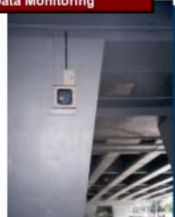
DMI-32 Multi-channel system now use for long term strain monitoring