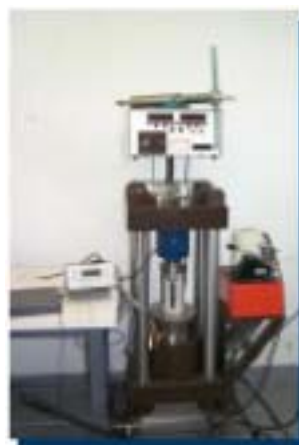
Tests on concrete