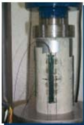
FOS-B bonded on concrete