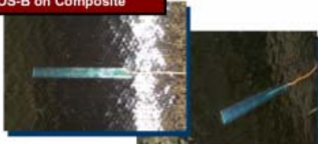
FOS-B installed between composite material sheets